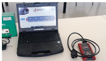
Des fournisseurs de diagnostic indépendants tels qu'EuroDFT proposent un accès sans problèmes aux différents portails OEM et fournissent le matériel nécessaire.