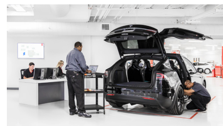
Voilà comment Tesla voit le poste de travail du futur : les travaux mécaniques passent à l'arrière-plan pour laisser la place aux mises à jour logicielles et aux diagnostics.