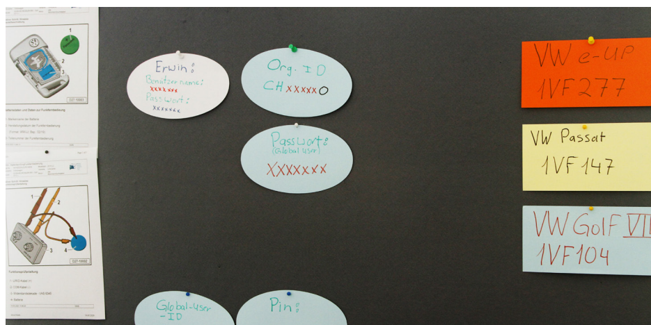
Comment s'annoncer auprès de quel constructeur et comment utiliser le système d'information de l'atelier pour travailler efficacement ? Durant le confinement, Autef a développé de nouvelles offres de formation pour répondre à ces questions.

Outre la procédure d'annonce complexe auprès du constructeur, il faut aussi s'assurer que l'appareil de diagnostic et l'interface OBD sont supportés (flash ready). Il y a là des différences importantes et il vaut la peine d'évaluer, sur la base de son fichier client, à quelles marques