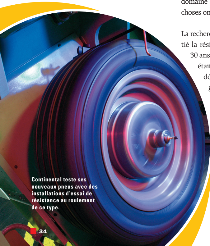
Continental teste ses nouveaux pneus avec des installations d'essai de résistance au roulement de ce type.

Divers conflits d'objectifs jouent un rôle décisif dans le développement des pneus. Citons par exemple la faible résistance au roulement par rapport à la sécurité ou les émissions sonores par rapport à la résistance au roulement. « Il est important de tenir compte de tous les critères », explique M. Schlenke. Il s'agit de trouver le meilleur équilibre possible pour chaque pneu. Mais attention : « Les critères de sécurité ne sont pas négociables ». Sur les voitures électriques, les pneus s'usent différemment, ce qui est notamment dû au poids de celles-ci. L'usure peut être jusqu'à 40% supérieure à celle des véhicules à essence, ce qui entraîne une baisse du kilométrage. Elle dépend également du type de véhicule et des pneus. Les véhicules électriques sont plus lourds et leur charge est répartie différemment. Les pneus de ces voitures nécessitent par ailleurs une pression de gonflage plus importante. « Les moments qui agissent sur la roue sont plus élevés. À plus ou moins long terme, cela peut entraîner une